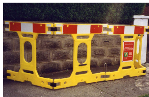
Combinação de baias permite delinear qualquer área