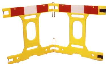
Art. nº 2M2SS